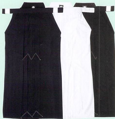
KH-0270(紺) KH-0280(白) KH-0290(黒)

KH-0270(紺) KH-0280(白) KH-0290(黒) 28~21 10,400円+税 20~16 10,000円+税 (28/27/26/25/24/23/22/ 21/20/19/18/17/16)